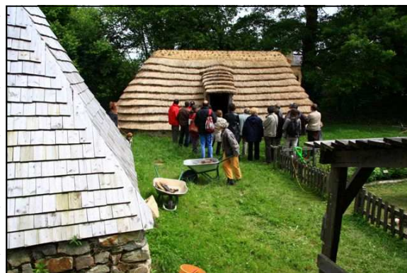
Les deux maisons d'habitation

La motte est entourée d'une douve et est surmontée d'une tour de guet. La plate-forme de la tour est entourée d'une palissade en bois avec cré-