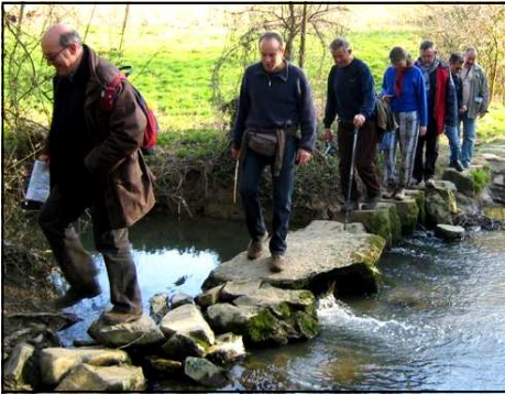
Les restes du gué au passage du ruisseau

L'objectif premier était de reconnaître le tracé de la voie antique Rennes Nantes. Nous l'avons reconnu aisément entre la D48 au nord jusqu'au village de la Haute Rue au sud en passant par la Basse Rue, toponymes évocateurs d'anciennes voies. Ce tracé se présente sous la