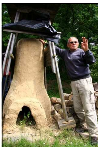
Le bas fourneau

On y trouve les constructions caractéristiques de l'époque : fours de