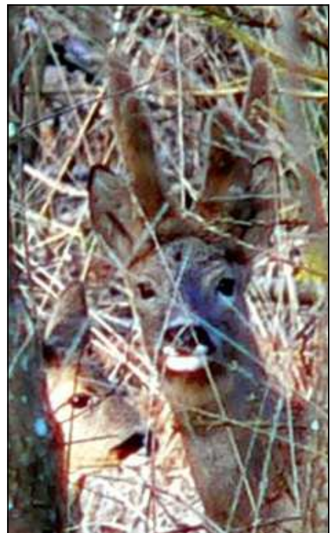
Une rencontre fort sympathique

L a géologie Sur le plan géologique, les formations les plus anciennes sont du Protérozoïque ou plus exactement du Briovérien supérieur.