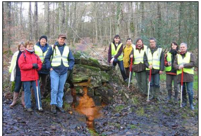
Les prospecteurs devant la fontaine minérale

Le site appartient à une ligne de hauteurs que l'on peut suivre d'est en ouest de Châtillon en Vendelais à Saint-Aubin-du-Cormier. La ligne de crête, presque ininterrompue, s'infléchit vers le sud au niveau de la commune d'Erceé-près-Liffré. De légères pentes conduisent au nord vers le ruisseau de Riclon et au sud vers l'étang et le ruisseau d'Oué. A l'ouest, au milieu du massif, coule le ruisseau de Moroval.