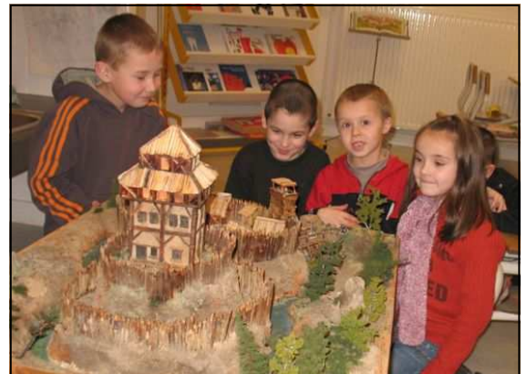
Les élèves de CP ont travaillé par petits groupes. L'un de ces groupes devant la maquette prêtée par le CERAPAR

Pour l'anecdote, les élèves ont beaucoup apprécié les petits personnages !