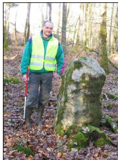
La découverte de Laurent

(découverte en surface de tegulae, céramiques et scories) et par le probable itinéraire antique en bordure est du massif qui a fait l'objet, en plus des prospections, des recherches d'archives. Les enclos sont rares, un seul a été détecté et a fait l'objet d'un relevé. Par comparaison, les massifs forestiers de Rennes et Liffré en comportent davantage. Il n'a pas été non plus découvert de tertres, alors que dans les massifs précités on en dénombre plus de quarante. A l'est de la forêt, en limite de massif, une structure de pierres sèches a été dessinée. Elle est d'époque indéterminée. Tous ces sites ont été décrits dans le document réalisé pour l'ONF. Un exemplaire est consultable au CERAPAR.