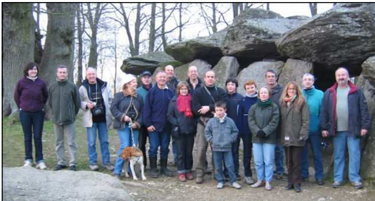
Mais quel est ce monument derrière le groupe ?