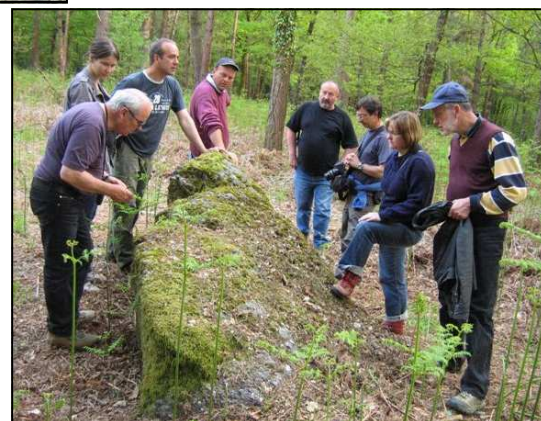
Beau menhir couché à boutavent

La journée s'est terminée à Boutavent, en Iffendic. Ici, c'est le poudingue de Monfort qui domine, reconnaissable à ses galets incrustés dans la roche. Le menhir du Bois de Boutavent et les blocs associés sont en poudingue de Monfort.