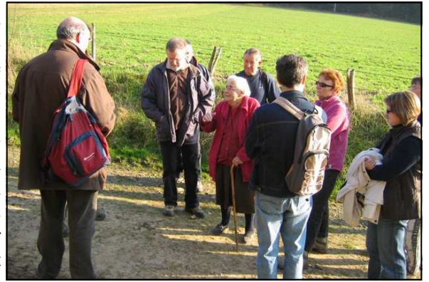
Très bon accueil par la propriétaire du manoir

La deuxième visite était consacrée à la maison forte de la Réauté où la propriétaire nous a réservé un excellent accueil. Construite au début du XVIe siècle, elle se trouve à 300m de la rive gauche de la Vilaine. Un manoir en partie moderne conserve une tour ronde et un pavillon carré. Une autre tour a été transformée en fuie et un corps de garde daté de 1503 possède une curieuse meurtrière carrée. Ce dernier servait à la surveillance de la navigation sur la