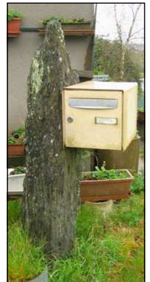
Après les meules gauloises, le menhir support de... boîte aux lettres

Cette journée, nous a fait prendre conscience de la richesse mégalithique du pays de Redon et du nombre de sites restant à répertorier et à relever.