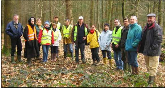
En forêt il faut se faire repérer !

Il s'agissait de trouver l'entrée en forêt de la voie Nantes-Corseul aux abords du site de la Ville-ès-Marie.