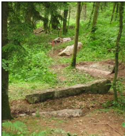
Le probable alignement de Haute-Sève

Très peu de documents existent concernant l'occupation préhistorique du site. Au XIXe siècle, des découvertes de haches polies sont signalées sur la commune mais sans aucune localisation précise.