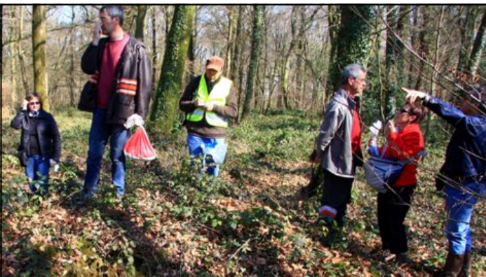
En prospection sur un ferrier en forêt de Montauban

On retrouve donc dans cette zone toutes les activités nécessaires à la production de fer : extraction du minerai dans les minières, réduction du fer en bas fourneau avec rejets des scories entassées en ferriers, production de charbon de bois pour la combustion du bas fourneau grâce à la forêt.