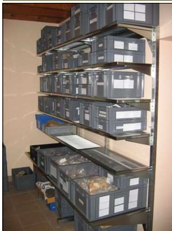
Les nouvelles étagères du local rangement

- Il devenait urgent d'optimiser le rangement des collections dans le local prévu à cet effet. L'acquisition de nouvelles étagères a permis une nouvelle organisation et une gestion de l'espace plus rationnelle. Par la même occasion, une boîte à outils complète a été achetée.