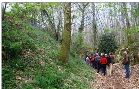
L'impressionnante motte de la Carriais

La motte féodale de la Carriais, appelée aussi « la Butte aux Blaireaux » ou Véréals (nom signifiant la défense royale) est située près du village de la Carriais. Elle est impressionnante par ses dimensions : une hauteur de 10 m, une plateforme sommitale de 30 m et une douve qui dépasse les 150 m de circonférence. Elle se classe donc parmi les mottes les plus importantes du département. L'emplacement de la basse-cour n'est pas défini, toutefois, dans le bois attenant à la motte, de nombreux talus apparaissent, limites possibles de cette basse-cour. De plus, la présence de fragon et de pervenche constitue des indices d'occupa-