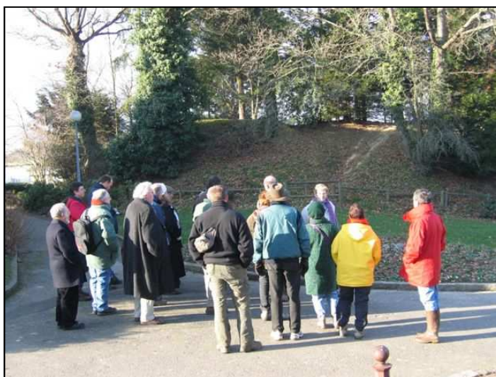
Devant la motte féodale bien conservée de Montgermont

La journée s'est terminée à la Maison de l'Archéologie par la traditionnelle galette des rois.