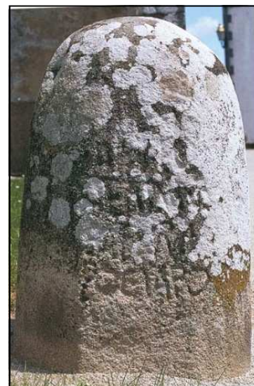
La stèle épigraphique de Plumergat

La journée s'est terminée à Plumergat. A côté de l'église, on remarque d'abord une stèle épigraphique, unique exemplaire de notre région à porter une inscription en langue gauloise. Dix autres stèles hémisphériques de l'Age de Fer ont été intégrées dans le muret qui entoure l'église paroissiale. Celle-ci, dédiée à saint Thuriau, conserve des arcades et des chapiteaux romans.