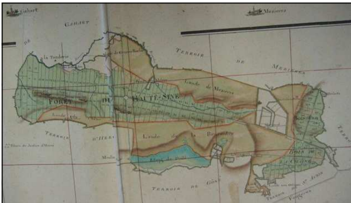
La forêt de Haute-Sève en 1788