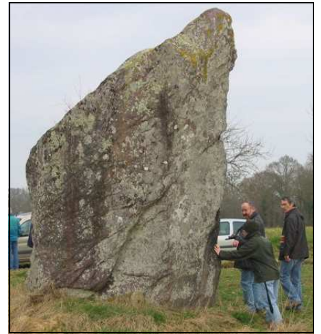
La Pierre aux Fées en Janzé

La journée s'est terminée à la Roche aux Fées en Essé. Le but de la journée était de replacer ce dolmen à portique dans son contexte, c'est-à-dire proche d'une voie de passage entre la Mayenne et la