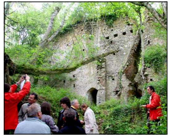
Les beaux restes du château d'Aubigné

dizaine de mètres de haut. La motte, sur laquelle s'élèvent les vestiges du donjon, est protégée, au nord, par plusieurs défenses en tenaille qui se succèdent : un fossé, une basse-cour dite « butte du château », et un second fossé. Lui succède une vaste esplanade qui regroupe un ensemble de parcelles portant les noms évocateurs de courtil au duc , l'hôpital , la salle verte , le presbytère . Un troisième fossé disparu de nos jours venait cerner cet ensemble au nord et l'isoler du bourg. Au sud, un étang en forme de croissant protège l'ensemble. Cet étang communiquait certainement à l'origine avec deux des trois fossés. L'accès au château se faisait à partir du bourg, vers le nord-ouest, comme