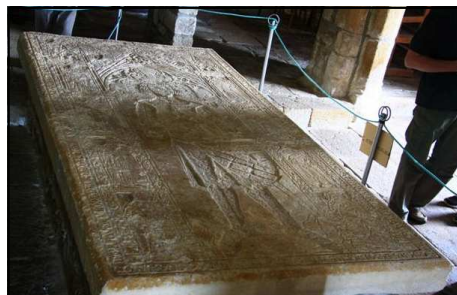
La pierre tombale de Pierre de Broérec

grès, longue de 3 m et large de 1,5 m, représente un chevalier couché sur le dos à la manière d'un gisant. Le travail de gravure est remarquable. Pierre de Broérec est mort à Saumur en 1340 en revenant de la guerre entre la France et l'Angleterre.