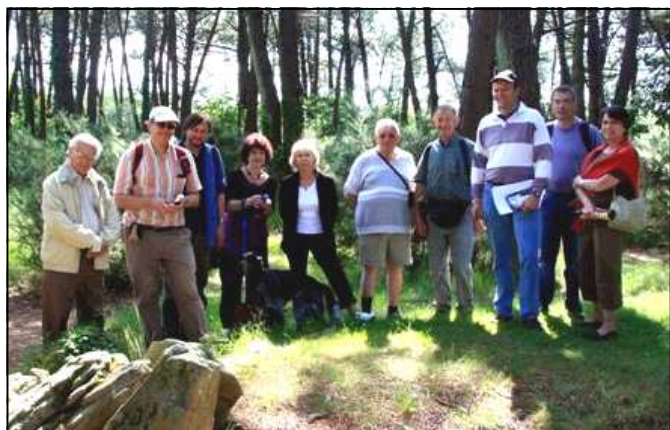
Sur le site de Kernourz au Bono