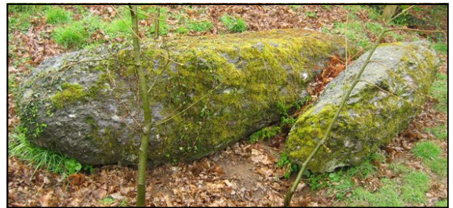
Les menhirs couchés de Bel-Air, un beau site !

Le groupe s'est ensuite rendu à Bel Air en Saint-Just. A côté du menhir christianisé de Bel Air, un menhir couché de 7 mètres de long sert d'embase au mur d'une maison. Dans le jardin, on remarque des menhirs couchés, de nombreux blocs, des affleurements de schiste à poudingue. Comme sur le site de la Porte, on est en face d'un ensemble très bouleversé, mais dont les restes sont imposants. De l'autre côté de la route, un affleurement forme un surplomb qui se prolonge dans une ancienne écurie. Est-ce une ancienne carrière ? ou un abri plus ancien ?