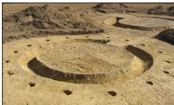
L'étonnant tumulus du site de la Montagne en Visseiche avec ses 17 trous de poteaux !

Le troisième tumulus était entouré de 17 trous de poteaux et a livré les restes d'une stèle. On peut l'imaginer comme un tertre surmonté d'une stèle et entouré de 17 poteaux reliés par des poutres formant un portique