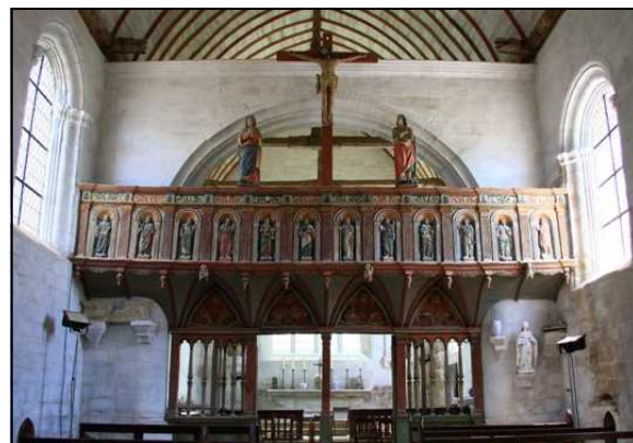
Le jubé de la chapelle Saint-Avoye en Pluneret