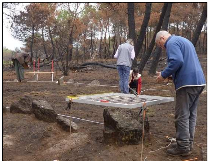
Le souci de la précision lors du relevé des blocs du tertre de la Croix-Madame

Ils sont tout ou partie signalés dans des descriptions manuscrites ou sur des plans conservés dans divers fonds d'archives (Bachelot de la Pylaie, Institut de France, 1829 ; Joseph Desmars, Archives Départementales d'Ille-et-Vilaine, 1869).