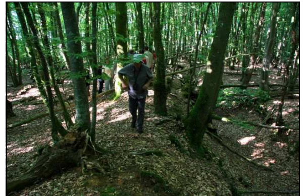
Une vue des talus de l'enclos du bois du Champ Lion à Saint-Sauveur-des-Landes

38 et 50m. Deux ouvertures sont présentes : une de 5m à l'ouest et une plus petite au nord-est. Les fossés atteignent une profondeur maximale de 3m et, dans la partie sud-ouest de l'enclos, de nombreuses pierres apparaissent, signe probable d'une ancienne construction. Autour de cet enclos s'élève une série de talus fossés à profil variable et d'anciens axes de circulation reconnaissables par leur bombé caractéristique, signes d'un site important. L'analyse de ce site est difficile, mais de par la forme et les dimensions de l'enclos principal, il n'est pas exclu de le dater de la période gauloise avec une réutilisation à la période médiévale. Le rôle fossilisateur du milieu forestier est ici bien mis en évidence.