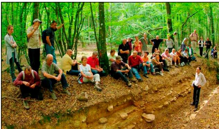
De nombreux participants à cette randonnée, ici devant la coupe de la voie romaine