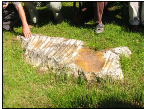
Le polissoir de Saint-Benoist

Les amateurs de très vieilles pierres ont été comblés par la découverte d'un des deux polissoirs néolithiques du département, celui de Saint-Benoist, sur la Départementale 363 près de Saint-James. Les polissoirs sont des roches de plus ou moins grandes dimensions (certains sont "portatifs") qui servaient à polir les pierres utilisées dans la