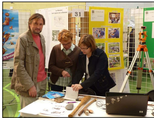
Les volontaires assurent un accueil chaleureux aux pacéens.

Encore un bon cru cette année pour ce rendez-vous habituel de début septembre, puisque de nombreux visiteurs se sont arrêtés devant le stand du CERAPAR. Il fallait répondre aux questions des pacéens, toujours aussi diverses et fort intéressantes. Cette année encore, plusieurs adhésions ont été enregistrées et de nombreux contacts ont été pris lors de cette journée.