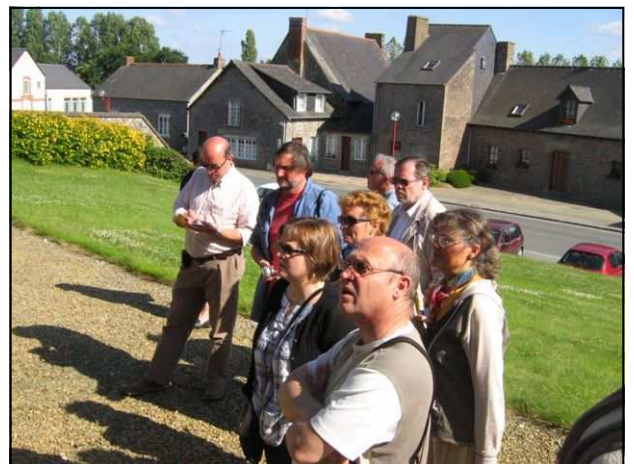
Devant l'église de St-Sauveur-des-Landes

Nous nous sommes quittés devant l'église de Saint-Sauveur-des-Landes qui possède contre le mur sud quatre pierres tombales dont une datée du XVIe siècle.