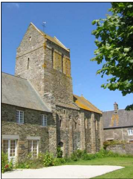
Le prieuré Saint-Léonard

A l'intérieur, la travée supportant la tour est délimitée par de gros piliers qui reçoivent quatre arcs en plein-cintre encadrant une voûte d'arêtes.