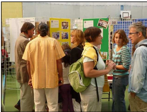
De nombreux visiteurs se pressaient devant le stand du CERAPAR