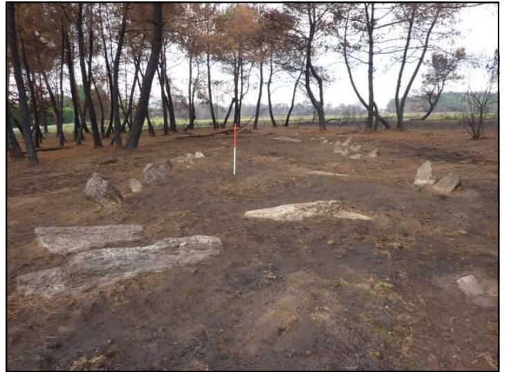
Après nettoyage, le tertre de la Croix-Madame dans toute sa splendeur !

De l'est vers l'ouest, en partant de la file nord-sud des alignements du Moulin, un bombement de terrain, identifiable sur une quinzaine de mètres de largeur pour 70m de longueur, contient de nombreux blocs de schiste et de poudingue formant une sorte de ligne. Cet ensemble bouleversé par les cultures et les fouilles clandestines, reste toute-