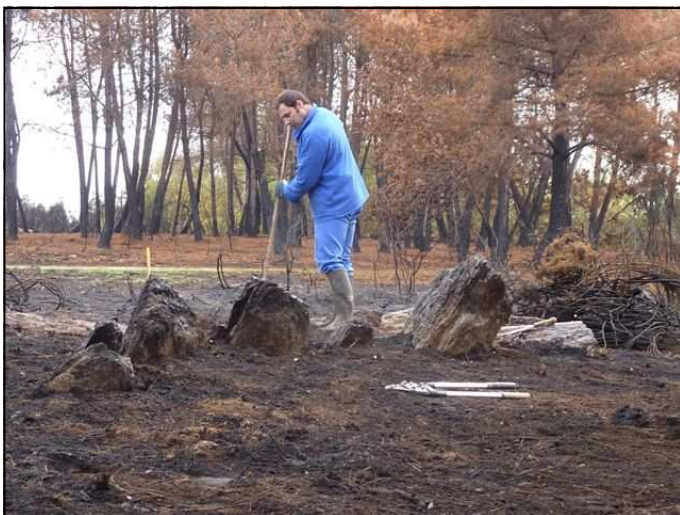
Nettoyage des zones touchées par l'incendie

Le nettoyage dû à l'incendie a permis de préciser les relevés déjà effectués sur les deux tertres tumulaires. Des blocs nouveaux ont été repérés et intégrés aux nouveaux plans. A proximité, un autre tertre signalé dans les textes anciens est encore