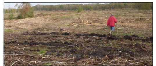
Les restes d'une charbonnière

trouve parallèle au chemin d'exploitation, près du lieu-dit La Haie. Dans la parcelle 29, un talus nord-sud apparaît, mais il est très ténu. En fin de journée, madame Ontrup nous a montré les réseaux de douves et de talus qui constituaient un système défensif complet autour du château de Montauban.