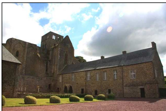
L'abbaye vue du côté du cloître

Le premier site visité, l'abbaye de Hambye, fondée par le seigneur du même nom, a été construite entre 1150 et 1250 dans un mélange de style roman et gothique. Des transformations y ont été effectuées au XVe siècle.