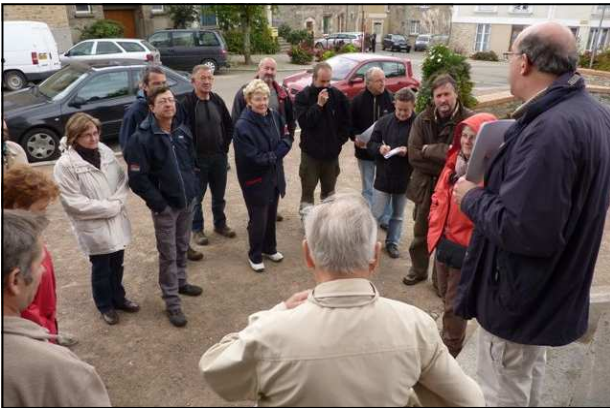
Quelques généralités avant le départ

Le 17 octobre, une vingtaine de membres du CERAPAR ont prospecté la voie Nantes-Rennes autour de Bourg-des-Comptes. Cet itinéraire reliait la vallée de la Loire : Portus Namnetum (Nantes) - Juliomagus (Angers), à la zone Condate (Rennes) - Reginca (Alet). Cela permettait d'éviter le contournement de la péninsule armoricaine pour accé-