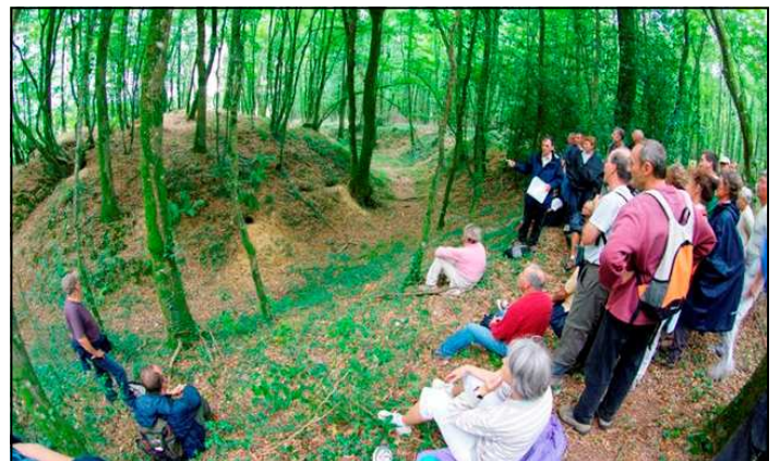
Un public très attentionné devant la motte de Dézerseul