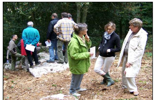
Près du mégalithe ruiné de la Plardais