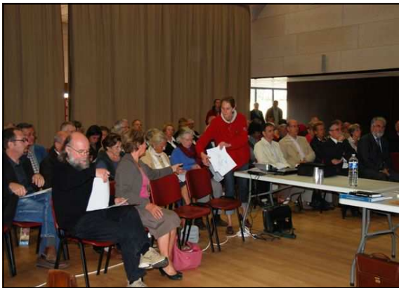
Belle affluence le 6 septembre à Corseul la Romaine

Yves Menez Les céramiques fumigées de l'ouest de la Gaule N°67-18