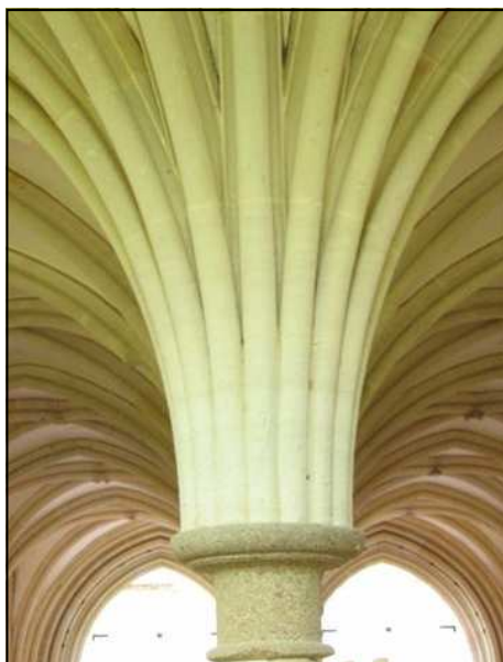
La colonne recevant les arcs

L'élément principal est l'église, ce beau vaisseau de 25m, surmontée d'une tour qui culmine, tel un puissant espar, à 30m de hauteur. On retrouve ici la sérénité d'une nef très sobre qui incite le regard à s'élever. Le transept et le cœur sont toutefois plus décorés : une scène de chasse, des