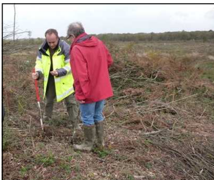
Pas de mobilier lors de cette sortie

Dans la parcelle 28 (en coupe rase), de nombreuses charbonnières ont été détectées, signes d'une exploitation intense. A l'extrémité de la parcelle, un talus est-ouest apparaît, il n'est pas signalé sur le plan de la forêt au XVIIIe siècle. On le re-