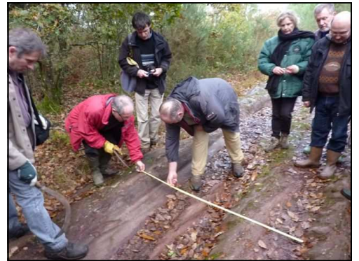
Mesure de l'écartement des ornières sur l'ancienne voie Rennes-Carhaix