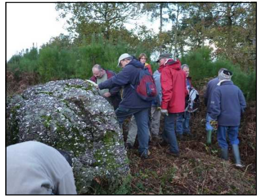
Recherche de mégalithes au sommet du bois

Sur le chemin du retour, nous observons les ornières creusées dans la roche sur l'ancienne voie Rennes-Carhaix, ainsi que des annélides fossiles dans un affleurement de schiste de Pont-Réan (465 millions d'années).