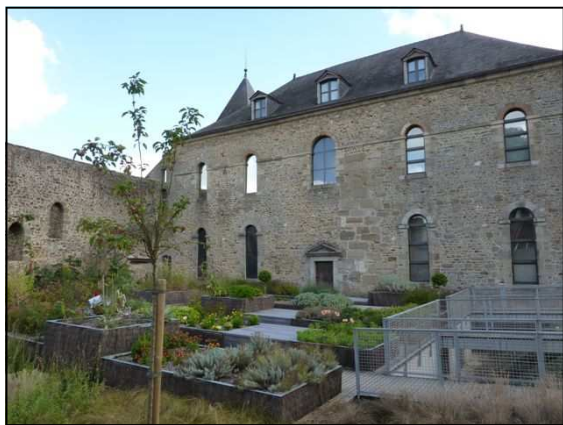
Le château de Mayenne et son jardin médiéval