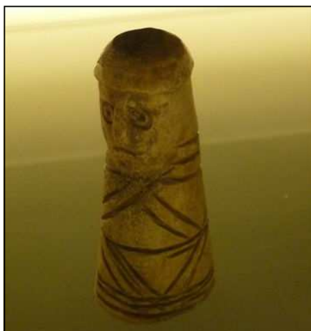
Pièce de jeu d'échec du XI e siècle

L'aula, ou salle de réception du palais du XI e siècle, présente une architecture exceptionnelle. On y voit sept arcades carolingiennes en briques enchevêtrées dans les murs et ouvertures des différentes époques. L'aula était flanquée d'une tour carrée où se