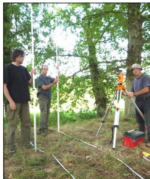
Une partie de l'équipe ayant participé aux relevés

C'est à l'aide d'un théodolite couplé à un lasermètre que l'équipe a réalisé les mesures. Elles ont permis d'établir un plan précis de la structure en trois dimensions. Ce plan viendra enrichir les connaissances sur ce site et sera transmis au Service Régional de l'Archéologie sous forme de complément à la déclaration de site.