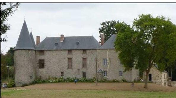
Le château du Bertry

Le groupe s'est ensuite rendu à La Plardais. En 1886, Bézier y a décrit trois menhirs : l'un d'eux est encore en place, ainsi qu'une fosse avec pierres de calage. A 60m à l'Est, on retrouve le dolmen ruiné décrit par Bézier. Ce sont les possibles restes d'une allée couverte en quartzite blanc, orientée est-ouest, effondrée sur la pente de la vallée de la Veuvre. On distingue quatre blocs de grande taille : ce sont probablement des tables de recouvrement.