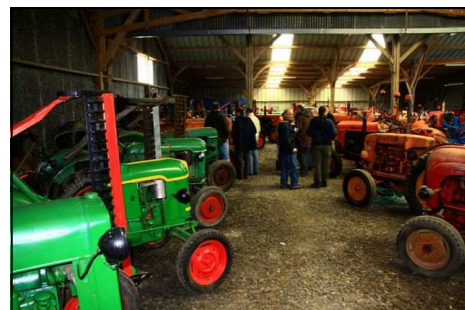
115 tracteurs présentés dans le « musée paysan »