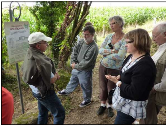
Discussion près de l'allée couverte du Petit Vieux-Sou à Brécé

L'ensemble chambre couloir a une forme de bouteille, avec un rétrécissement progressif à mesure que l'on s'approche de l'entrée.