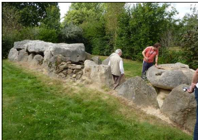
L'allée couverte de la Hamelinrière en Chantrigné

C'est une allée couverte de 11m de long sur 2m de large. Le monument a été fouillé et restauré entre 2000 et 2003. Le matériel recueilli présente une affinité avec l'industrie de la civilisation Seine-Oise-Marne, soit une datation de 3000 à 2500 av. J.C.. Tous les éléments mégalithiques ont retrouvé leur place d'origine, sauf deux blocs laissés en l'état. Le monument était inclus dans un cairn aujourd'hui disparu. Quatre autres monuments ont été visités dans l'après-midi :