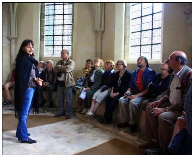
Des explications dans la salle capitulaire

Après un pique-nique (accompagné de cidre normand) au bord d'un étang de la forêt domaniale de Saint-Sever, nous sommes partis à la découverte de la belle motte du Vieux Château toute proche. Cette fortification, élevée dans la première