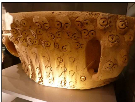
Au musée, poterie à œil de perdrix