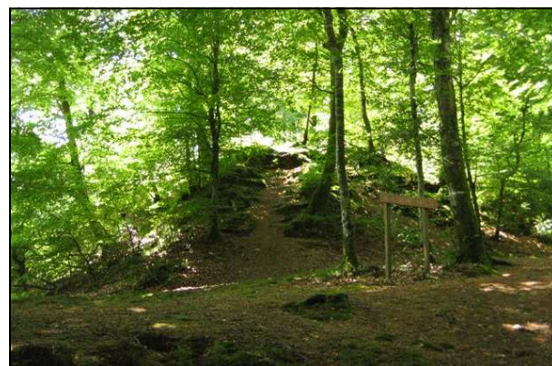
La motte du Vieux Château dans la forêt de St-Sever

Elle est installée sur un site en forme d'éperon qui s'élève progressivement vers l'ouest. La motte, ceinturée d'un fossé, est grossièrement circulaire et a une hauteur de 6m pour un diamètre de 27,5 m à sa base et de 12m au sommet. Elle est protégée à l'ouest par deux rangées de remparts et de fossés disposés en croissant de lune. Sur chacune de ces levées est aménagée une petite plate-forme sur laquelle ont pu être implantées des constructions adossées au talus. La basse-cour, de forme triangulaire, se trouve à l'est et est défendue naturellement par l'escarpement. L'ensemble de la fortification mesure un peu plus de 100m sur 80m.