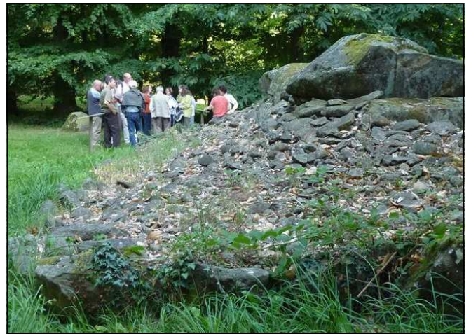
La Hutte aux Gabelous avec son pérystalithe

Les céramiques recueillies sont de deux types : néolithique, puis campaniforme, ce qui implique une occupation du site jusque vers 2000 à 1800 av. J.C..